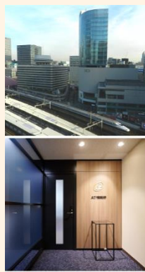
写真上:窓の外の 景観/写真下:エ ントランス

これまでもお客様の事業所で仕事をすることが多い当社の新しい拠点のあり方を模索しました。今後もリモートワーク含め、分散型の仕事が増えつつありますが、各所にいる社員が時折帰って来て、仕事や情報交換ができる場にした。それが結果としてお客様のためになると思い、レイアウトを具体化しました。