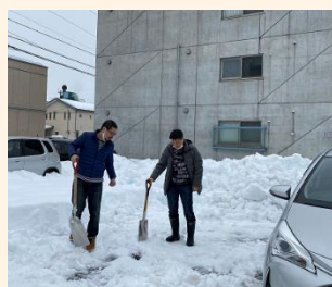
駐車場を2名で雪かき中...

今年からは年始から大雪となり、金沢でも3年ぶりの60cm以上の積雪を記録。車も雪に埋もれてしまいました。朝は、各自の駐車場の雪かきから始まりました。重い雪をひたすら運んでいく作業はたいへんです。全く降らない年もあれば、ドカンと降る冬もあるのが金沢です。まだ2月。この冬はしばらく要注意ですね！