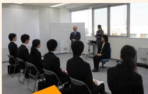
社長のお話を聞く内定者のみなさん

内定証書授与式では、内定者が緊張の面持ちで内定証書を受け取り一人ずつ今後の抱負を発表し、社長からは、皆さん